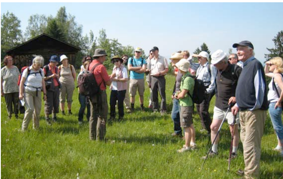
Exkursion auf der Bazora.